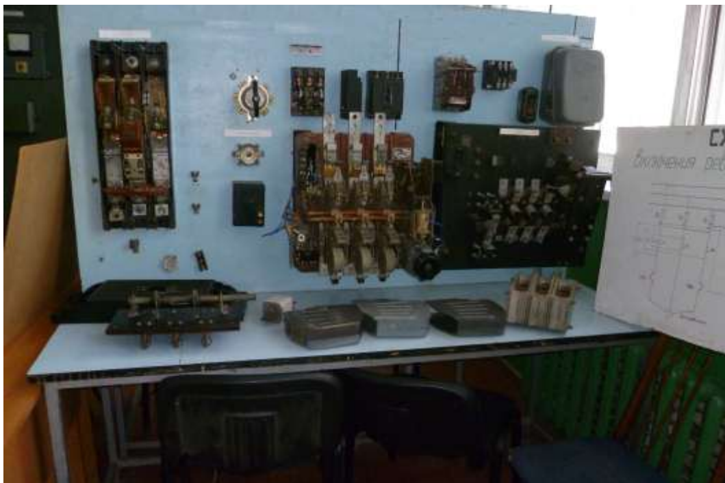
Рис.2. Зовнішній вигляд лабораторного стенду №2.1 з демонстративними матеріалами для вивчення електричних апаратів на напругу до 1000В