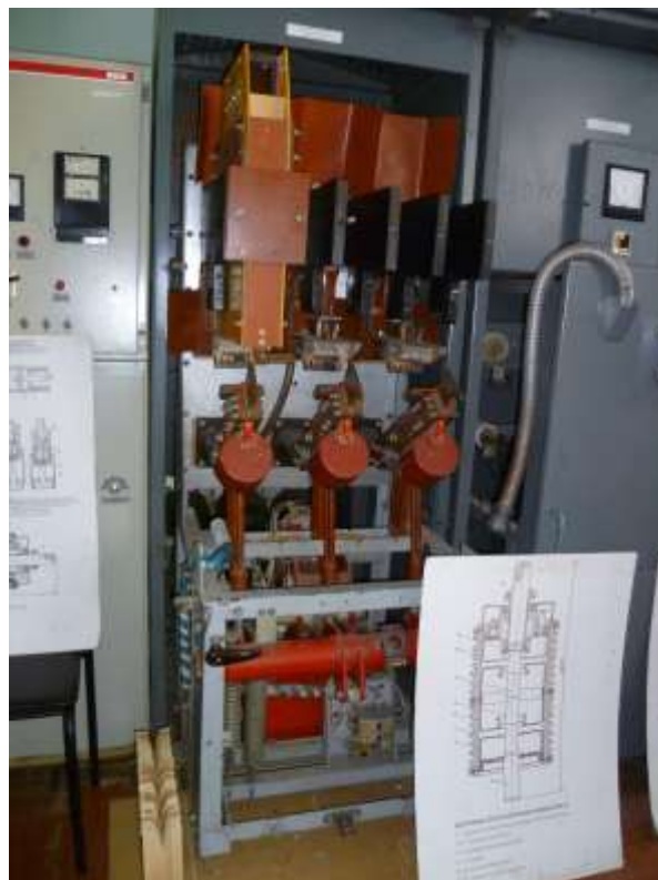
Рис.8. Зовнішній вигляд лабораторного стенду №4.1 з демонстративними матеріалами для вивчення конструкції дугогасної камери електромагнітних високовольтних вимикачів 10 кВ