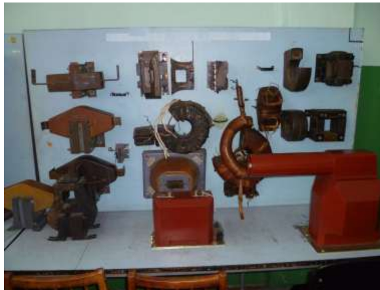
Рис.12. Зовнішній вигляд лабораторного стенду №8.1 з демонстративними матеріалами для вивчення конструкції вимірювальних трансформаторів струму 6(10) кВ