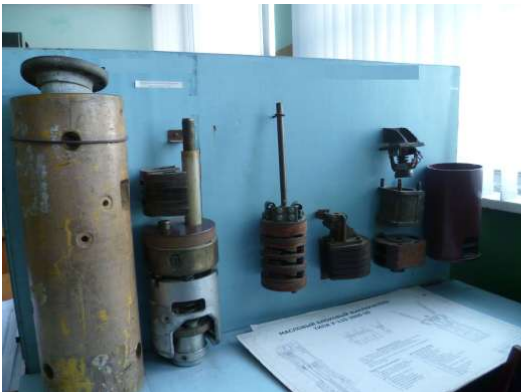
Рис.5. Зовнішній вигляд лабораторного стану №3.2 з демонстративними матеріалами для вивчення дугогасної камери великооб'ємних масляних вимикачів напругою 110 кВ