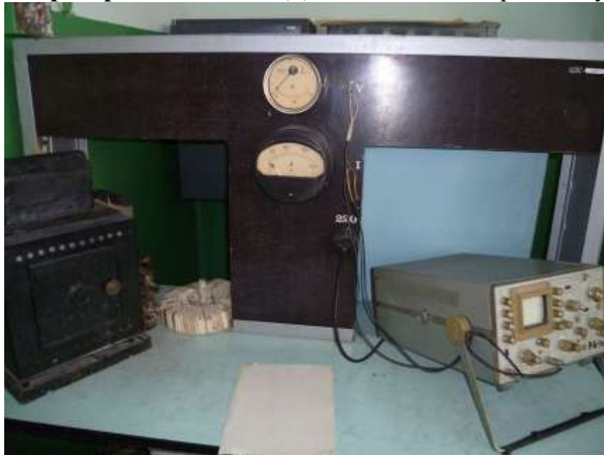
Рис.1 Зовнішній вигляд лабораторного стенду №1 з установкою для дослідження електричної дуги