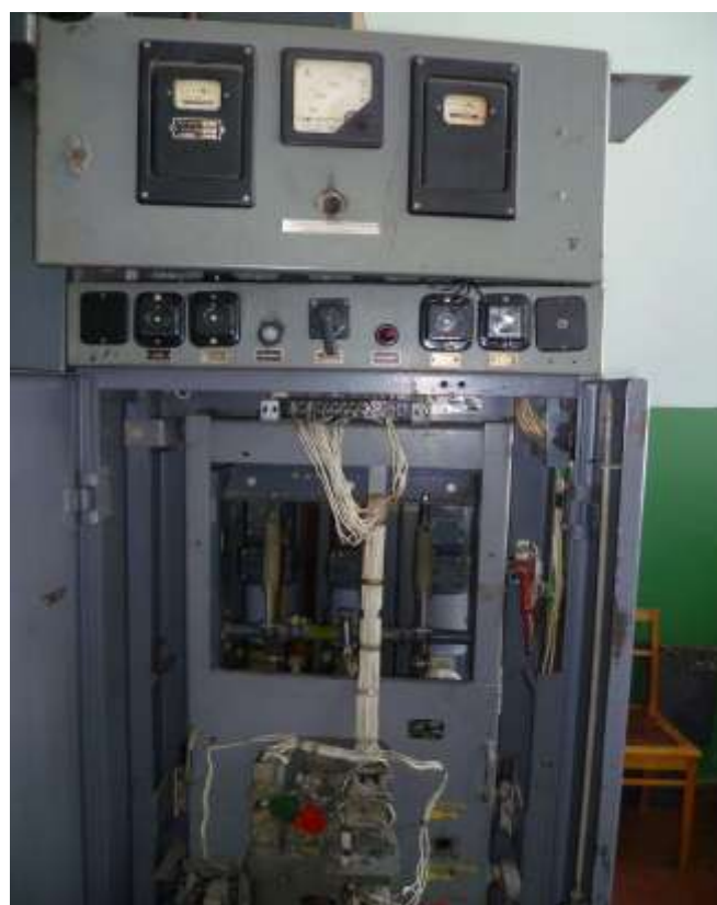
Рис.6. Зовнішній вигляд лабораторного стану №3.3 комплектна комірka зі встановленим малооб'ємним високовольтним вимикачем типу ВМП-6(10) кВ