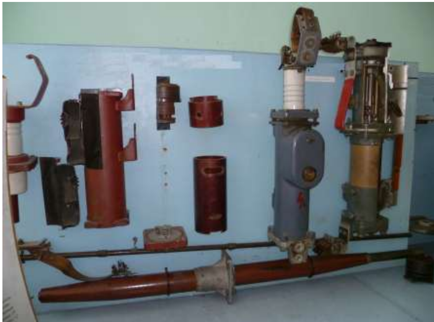
Рис.4. Зовнішній вигляд лабораторного стенду №3.1 з демонстративними матеріалами для вивчення конструкції дугогасної камери малооб'ємних масляних вимикачів напругою 6(10) кВ