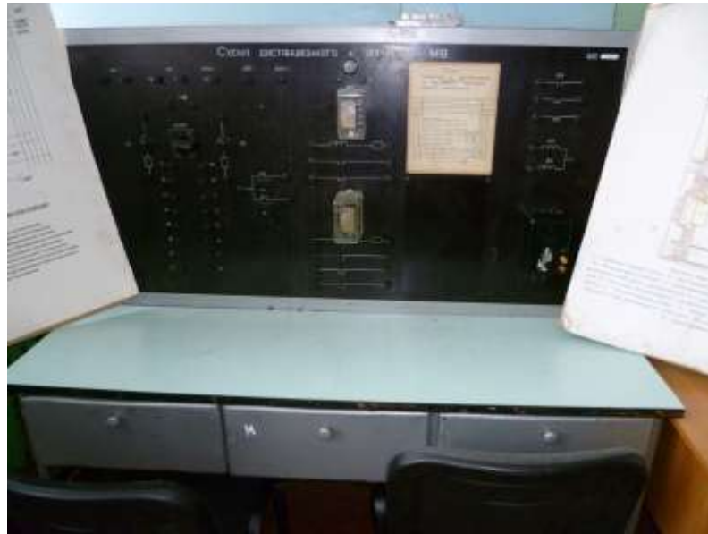
Рис.11. Зовнішній вигляд лабораторного стенду №7 з демонстративними матеріалами для вивчення принципів режиму роботи приводів високовольтних вимикачів