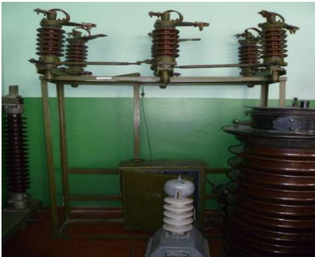
Рис.10. Зовнішній вигляд лабораторного стенду №6 з демонстративними матеріалами для вивчення конструкції роз'єднувачів, вимикачів навантаження, віддільників і короткозамикачів