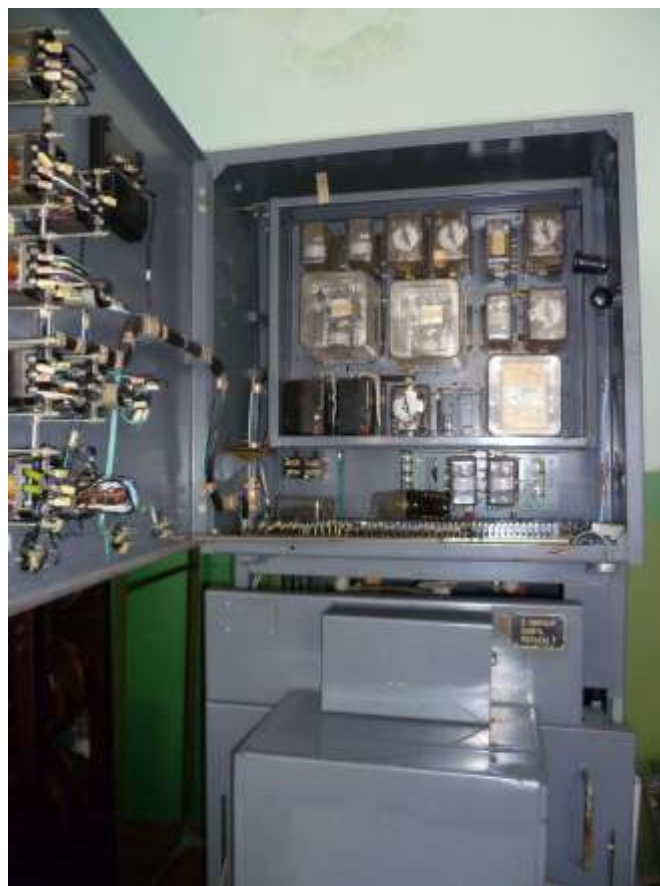
Рис.13. Зовнішній вигляд лабораторного стану №8.2 з демонстративними матеріалами для вивчення конструкції та принципів роботи виміривальних трансформаторів напруги 6-110 кВ