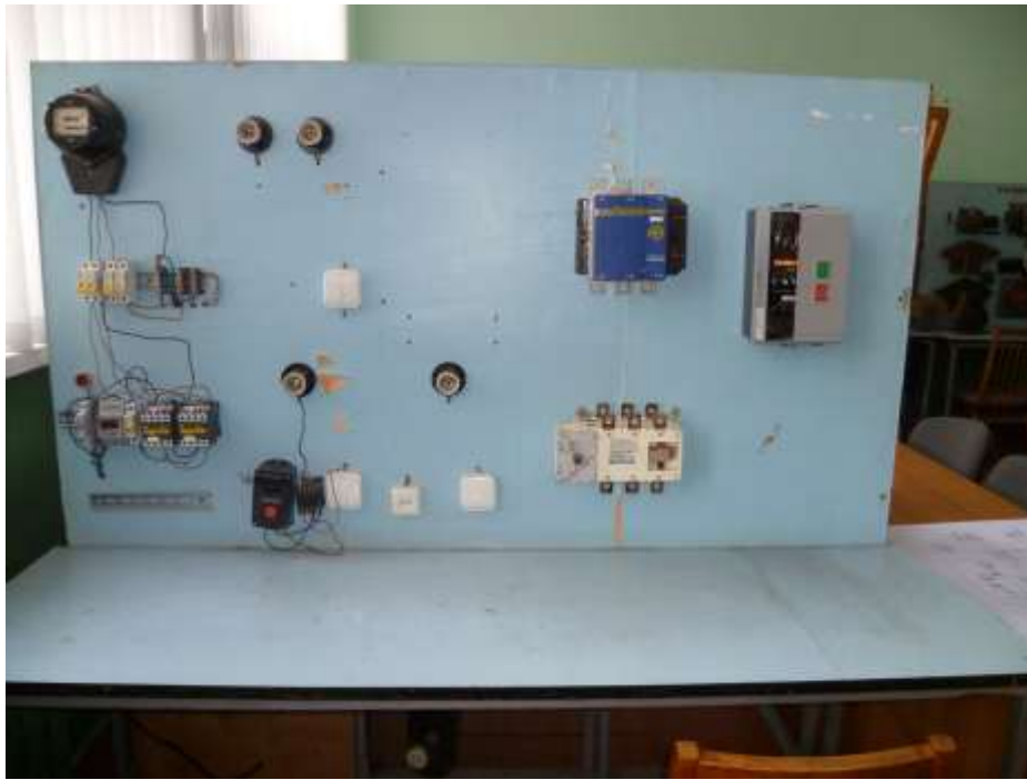
Рис.3. Зовнішній вигляд лабораторного стенду №2.2 для складання та демонстрації режиму роботи схеми живлення, сигналізації та керування елементами високовольтних комірок