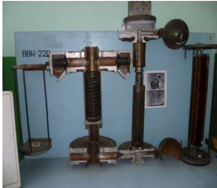
Рис.7. Зовнішній вигляд лабораторного стенду №4.1 з демонстративними матеріалами для вивчення конструкції дугогасної камери повітряних високовольтних вимикачів 220 кВ