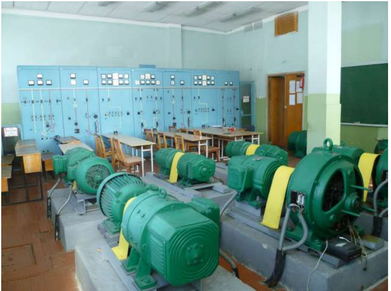
Рис.4. Зовнішній вигляд щита керування 2ЩУ з синхронними генераторами та двигунами постійного струму

Апарати комутації, керування і вимірювання, а також прилади сигналізації і захисту синхронних генераторів Г5 і Г6, їхніх двигунів Д5, Д6 і мотор-генератора МГ-2 (Д4, Г4), змонтовані на щиті керування 2ЩУ, що складається із семи панелей (8 - 14), уздовж яких змонтовані шини змінного струму напругою 380В і шини постійного струму напругою 220В.