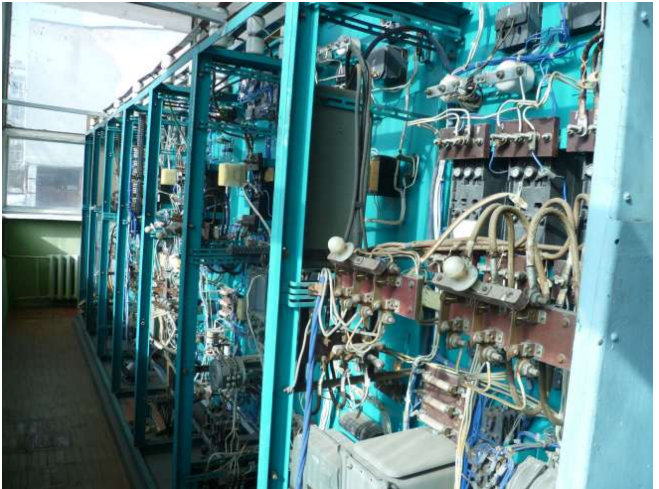
Рис.5. Зовнішній вигляд ланцюгів живлення, сигналізації та керування щитом 1ЩУ

У ланцюгах, що вимагають дистанційного керування (генератори, двигуни, автотрансформатор, перетворювач), додатково до автоматів передбачається установка магнітних пускачів (які мають додатковий захист) чи контакторів.