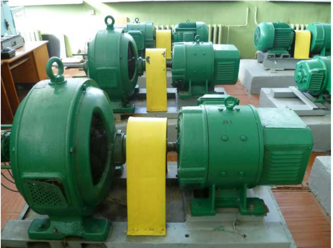
Рис.1. Зовнішній вигляд явнополюсних синхронних генераторів Г1, Г2 з відповідними двигунами постійного струму (Д1, Д2)

ЕДМ електричної станції розташовується в приміщенні 001 - лабораторії стійкості і призначена для фізичного моделювання перехідних процесів і інших режимів в електричних системах. ЕДМ обладнана синхронними генераторами.