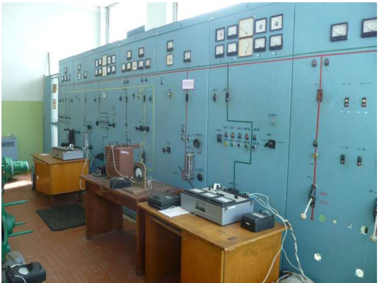
Рис.3. Зовнішній вигляд щита керування 1ЩУ з вимірювальними пристроями

ЕДМ обладнана двома мотор-генераторами (МГ-1, МГ-2) які можуть бути використані і як джерела постійного струму напругою 220 В. Потужність генераторів Г3 (МГ-1) і Г4 (МГ-2) — 16 кВт. Асинхронний двигун Д3 генератора Г3 розрахований на напругу 380 В. Потужність двигунів Д3 і Д4 — 220 кВт. Синхронні генератори Г1 і Г2 обладнані малопотужними однофазними синхронними генераторами з трьома парами полюсів (модульними генераторами). Збудження модульного генератора здійснюється від статичного перетворювача.