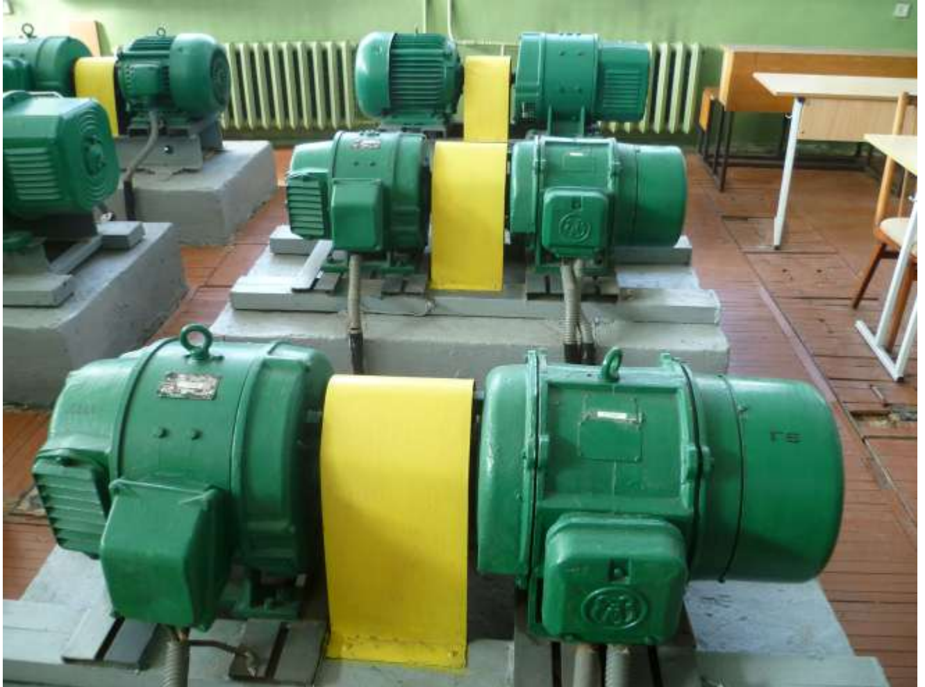
Рис.2. Зовнішній вигляд неявнополюсних синхронних генераторів Г5, Г6 з відповідними двигунами постійного струму (Д5, Д6)

Збудження синхронних генераторів Г1, Г2 здійснюється від двохпівперіодного мостового перетворювача, що живляться від вторинної обмотки однофазного трансформатора. Напруга на первинну обмотку трансформатора подається від регульованого автотрансформатора, що дає можливість регулювати напругу і струм збудження генератора.