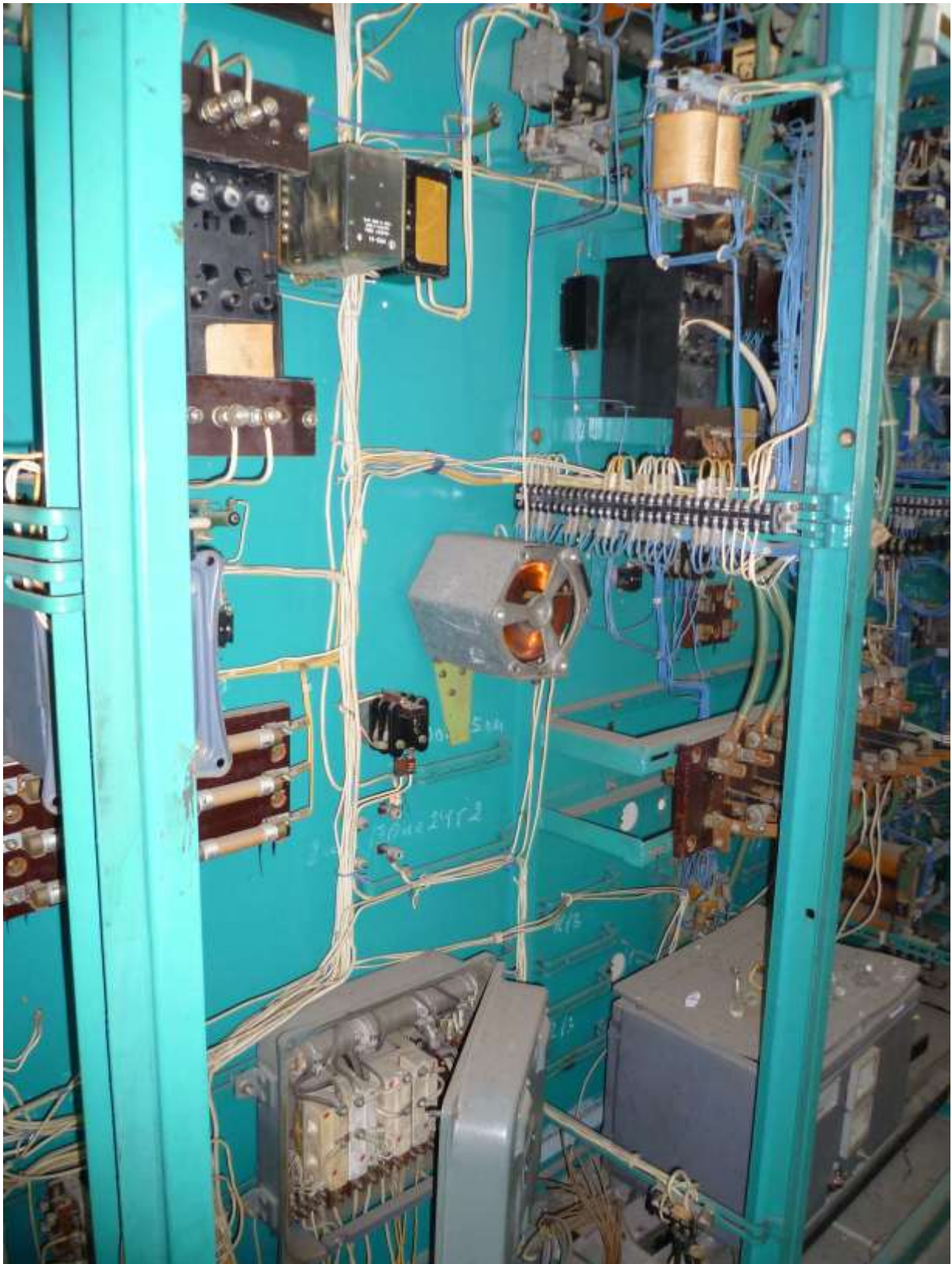
Рис.6. Зовнішній вигляд ланцюгів живлення, сигналізації та керування щитом 2ЩУ

контакторів. Якщо котушки керування контакторів виконані для постійного струму, то у відповідних ланцюгах передбачаються малопотужні двохпівперіодні мостові перетворювачі.